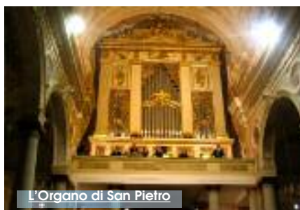
L'Organo di San Pietro