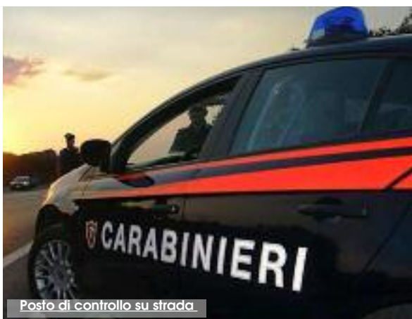
Posto di controllo su strada.