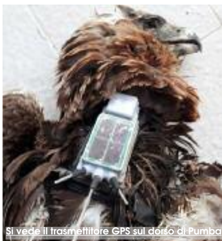
Si vede il trasmettitore GPS sul dorso di Pumba