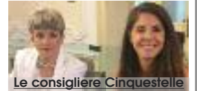
Le consigliere Cinquestelle